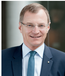
Thomas Stelzer Landeshauptmann