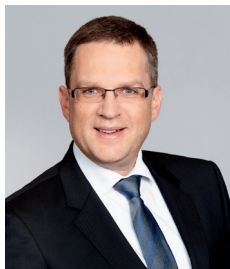
August Wöginger Klubobmann der ÖVP im Parlament