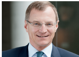
Mag. Thomas Stelzer Landeshauptmann