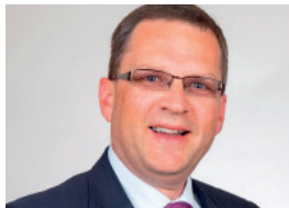
KO August Wöginger ÖAAB-Landesobmann