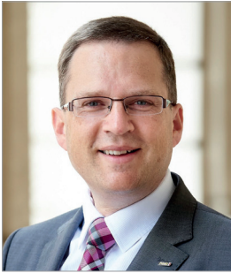
ÖAAB-Landesobmann Abg.z.NR August Wöginger