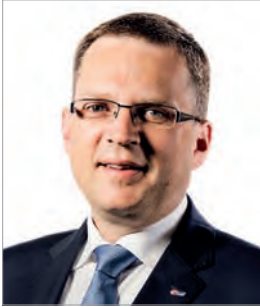
ÖAAB-Bundes- u. Landesobmann KO August Wöginger