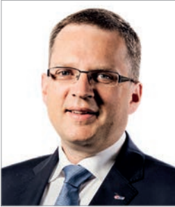
ÖAAB-Bundes- u. Landesobmann KO August Wöginger