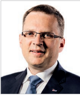
ÖAAB-Bundes- u. Landesobmann KO August Wöginger