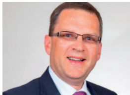
KO August Wöginger ÖAAB-Landesobmann