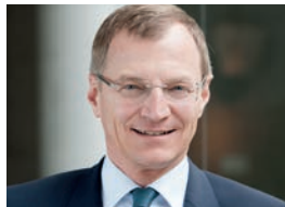
Mag. Thomas Stelzer Landeshauptmann