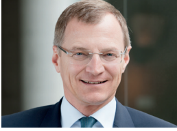
Mag. Thomas Stelzer Landeshauptmann