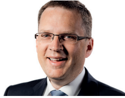
KO August Wöginger ÖAAB-Landesobmann